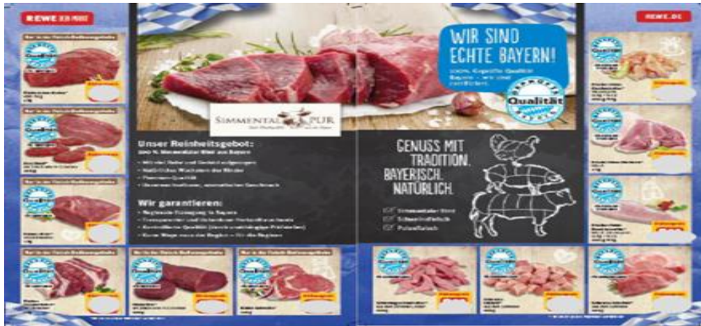
Beispiel: Simmental Pur bei Rewe Süd